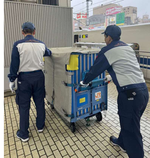
②駅でのお荷物の輸送イメージ