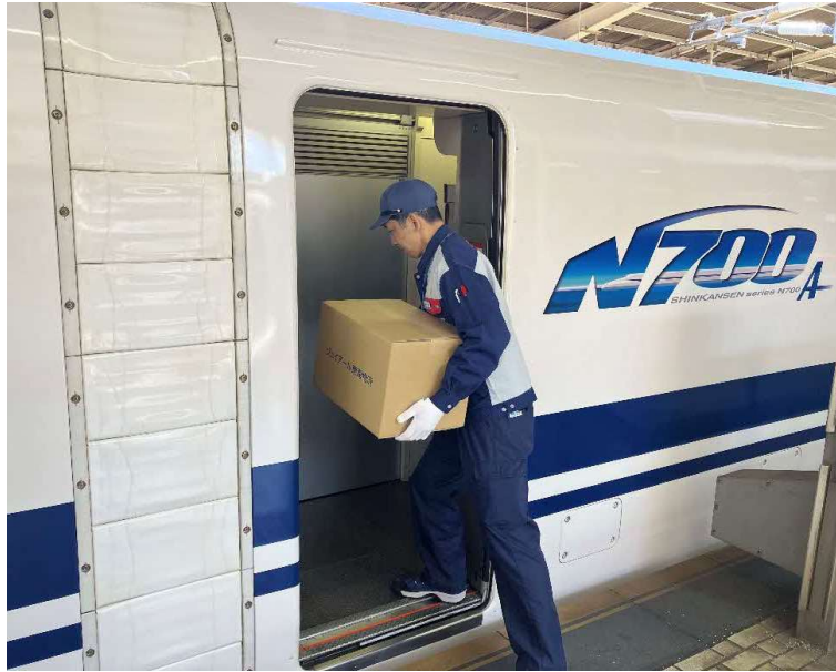
①お荷物の積み下ろしのイメージ